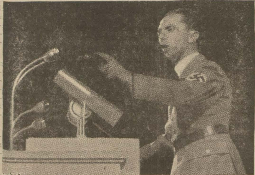
Alman Propaganda Nazırı Göbels Bolşeviklere ateş püsküren nutkunu Söylerken

Fransız kabinesi Hitlerin Nurenbergteki nutukları münasebetile alalecele toplandı ve müstemele meselesini ehemmiyetle tetkik etti