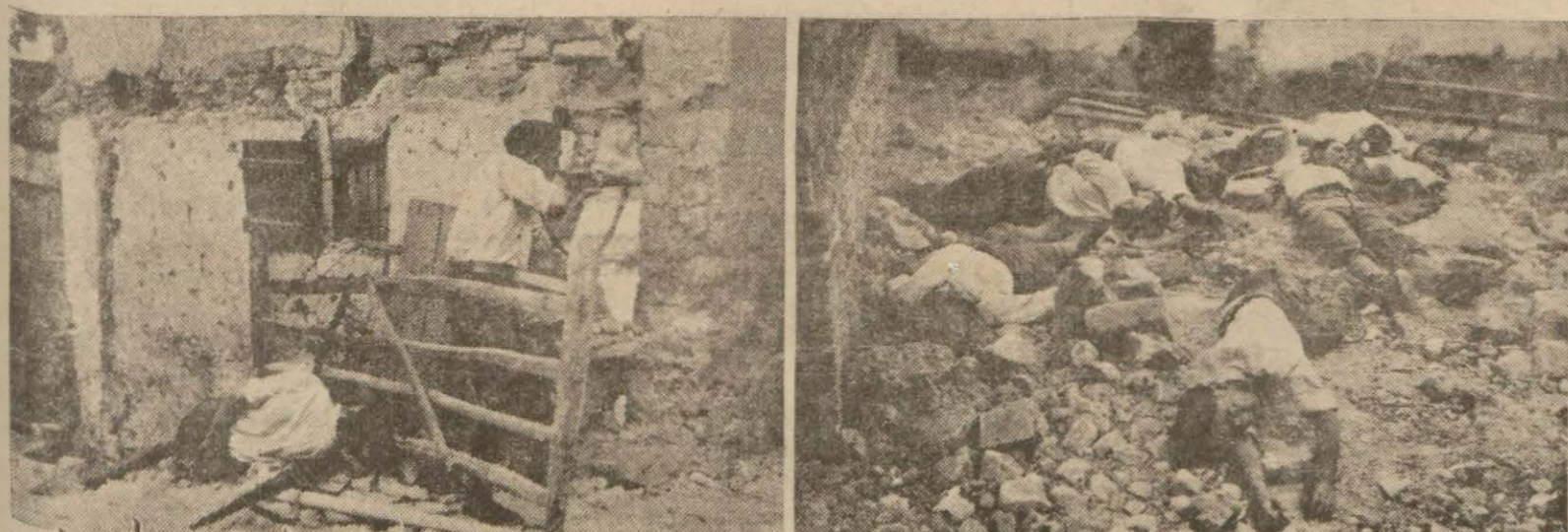
Solda hükûmet milisleri tarafından İrunun müdafaası, sağda şehir düştükten sonra bir sokağın feci manzarası (Yezısı 8 inci sayfada)

Âsi kuvvetler Bilbaoyu da almak üzere, Madrit dün tekrar bombardıman edildi, hükûmet başka yere taşınacak, idamlar devam ediyor