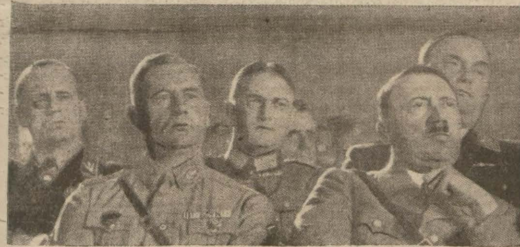
Hitler arkadaşlarıyla beraber nutku dinliyor (Yezısı 8 inci sayfada)