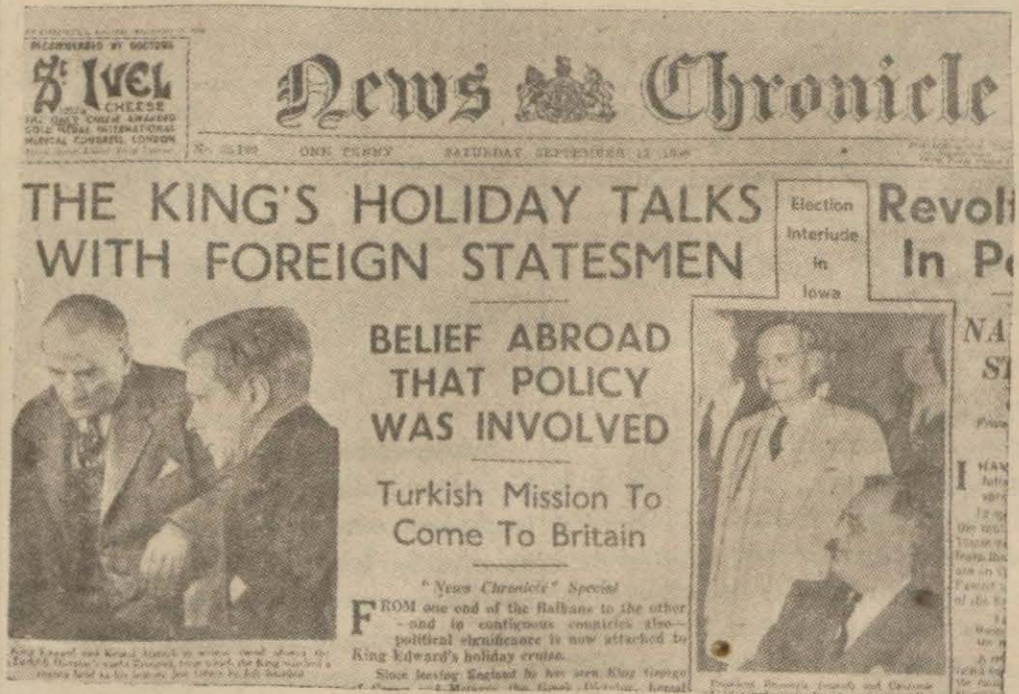
Niyuz Kronikl'in son gelen nüshasında Kral Edvard'ın seyahatinden bahseden parça (Yezısı 8 inci sayfada)

Niyuz Kronikl: “Kral Edvardın ziyaretleri, bozulmuş olan Akdeniz misakına dahil devletlerin İngiltereye karşı gösterdikleri çekingenliği izale etmiştir,, diyor